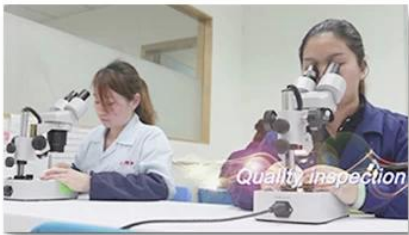
4. Quality inspection