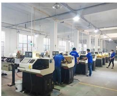
2. Lathe workshop