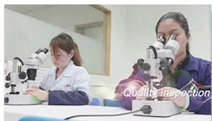
4. Quality inspection