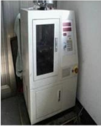
Spring exhausted tester