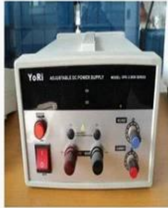
DC power supply