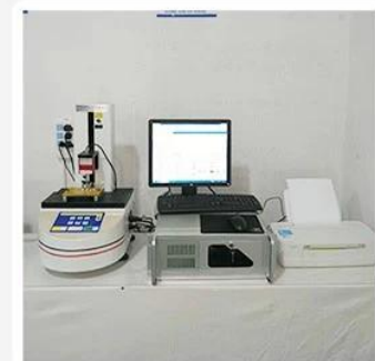
3. Load Curve Meter