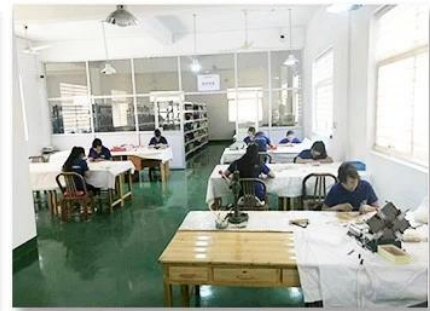
3. Assemble workshop