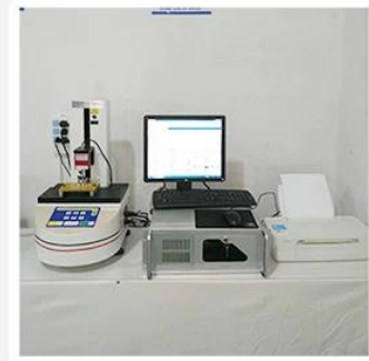
3. Load Curve Meter