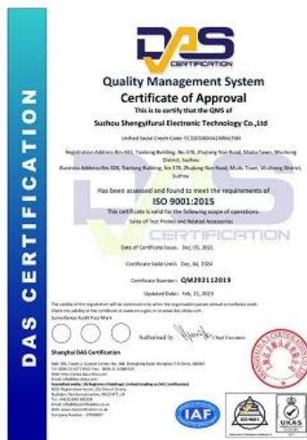
2023 ISO Certificate