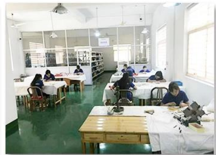
3. Assemble workshop