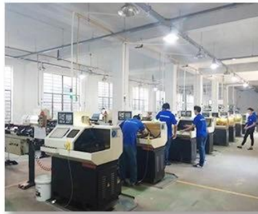
2. Lathe workshop