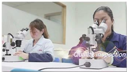
4. Quality inspection