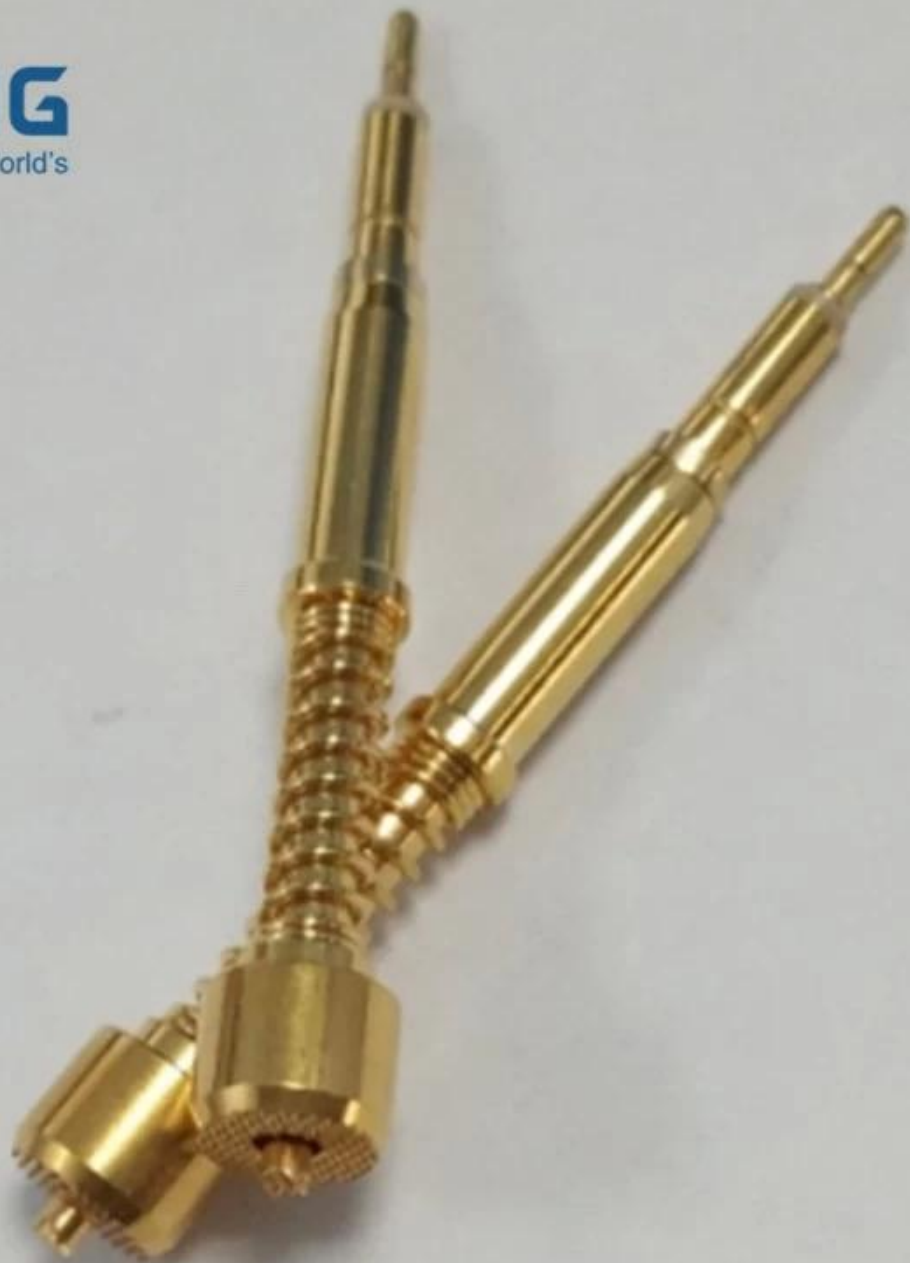
Zeichnung der koaxialen Kontaktsonde