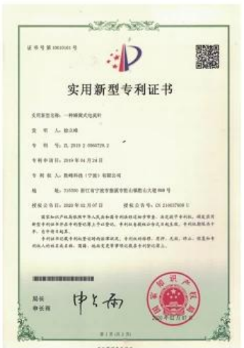
Patent for Honeycomb current probe