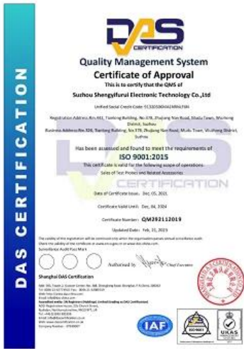
2023 ISO Certificate