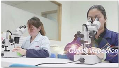
4. Quality inspection