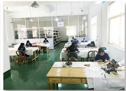
3. Assemble workshop