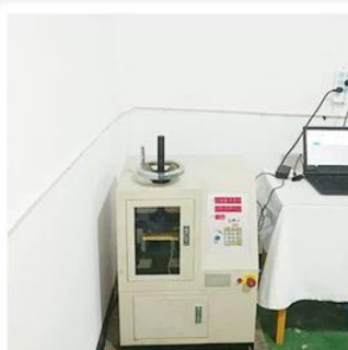
5. Life Fatigue Test