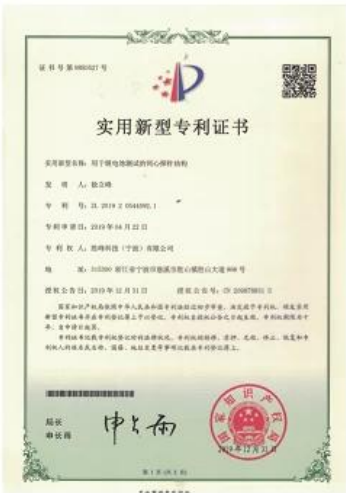
Patent for Coaxial Structure