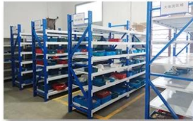
5. Finished products