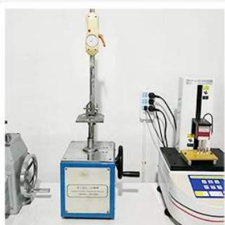
4. Bond Test