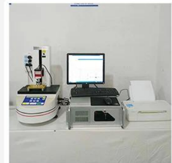
3. Load Curve Meter