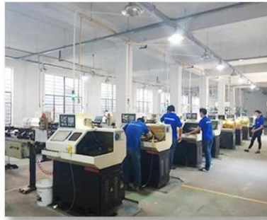
2. Lathe workshop