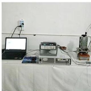
1. Agilent current testing