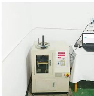
5. Life Fatigue Test