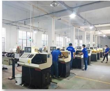
2. Lathe workshop