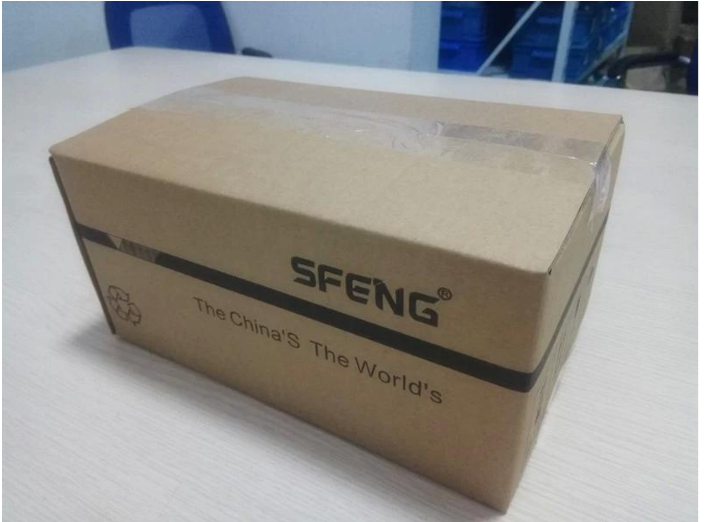
Certificacion de calidad