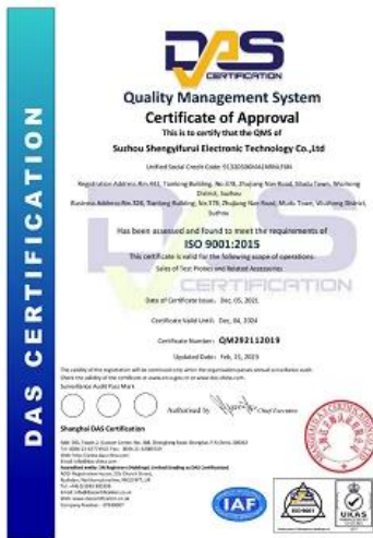
2023 ISO Certificate