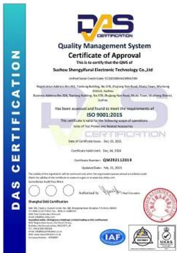
2023 ISO Certificate