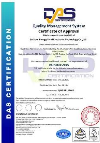
2023 ISO Certificate