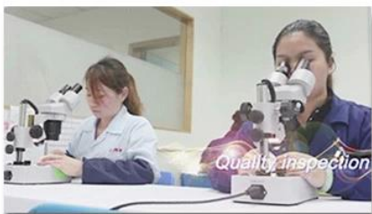
4. Quality inspection