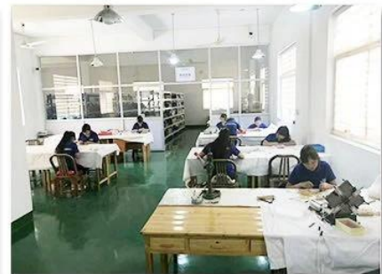
3. Assemble workshop