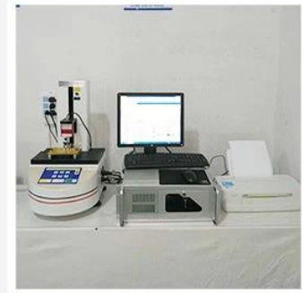
3. Load Curve Meter