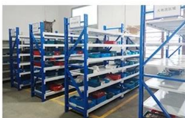
5. Finished products