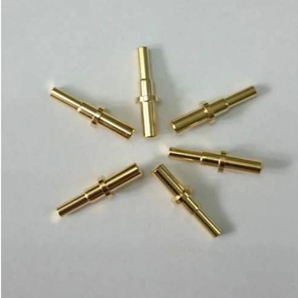
Foto del conector de pogo de la batería

Fuerza del resorte: 50g \pm 10% @ carga 4mm