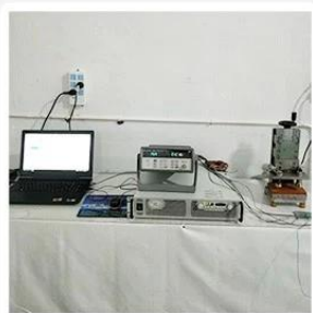
1. Agilent current testing