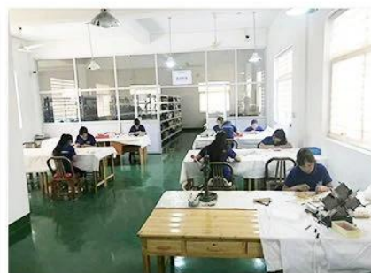
3. Assemble workshop