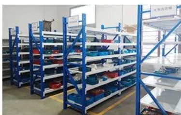
5. Finished products