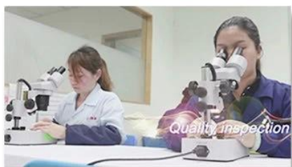
4. Quality inspection