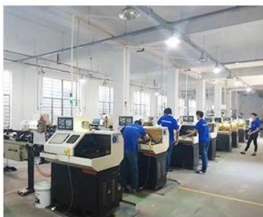
2. Lathe workshop