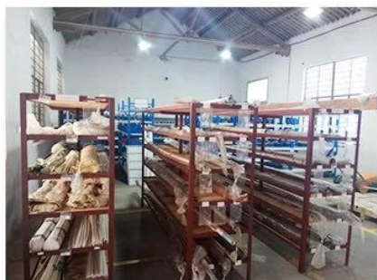
1. raw material warehouse