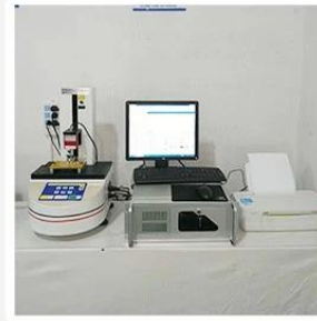
3. Load Curve Meter