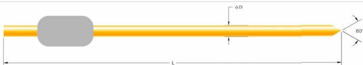
Tableau des tailles du produit