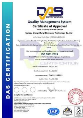
2023 ISO Certificate