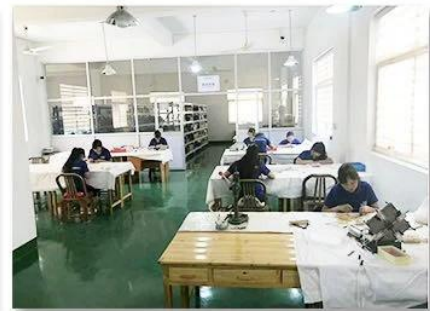
3. Assemble workshop