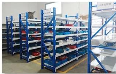
5. Finished products