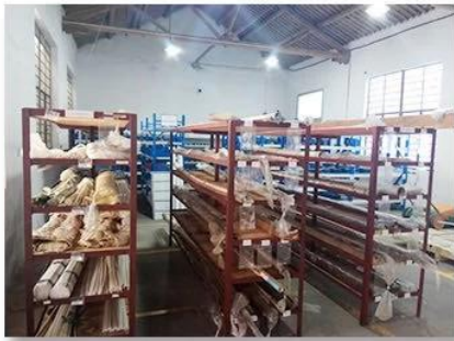
1. raw material warehouse