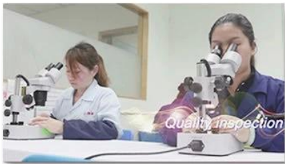
4. Quality inspection