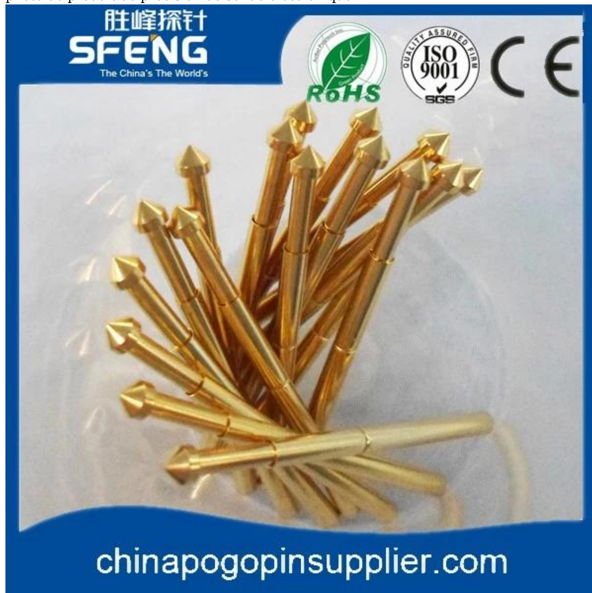
photo de produit de précision de sonde électronique

Suzhou Shengteng Electronic Co., Ltd se spécialise dans la sonde de ressort et la goupille de Pogo avec la qualité, le prix bas et la livraison rapide. Nous avons notre propre marque, nous nous consacrons toujours à la réalisation des normes internationales, notre compagnie ont passé la certification ISO9001-2008 de gestion de qualité et nos produits sont qualifiés de RoHS.