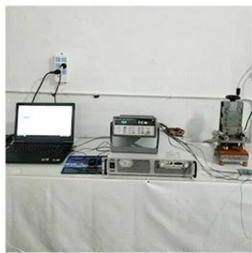
1. Agilent current testing