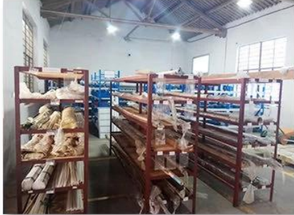
1. raw material warehouse