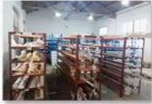
1. raw material warehouse