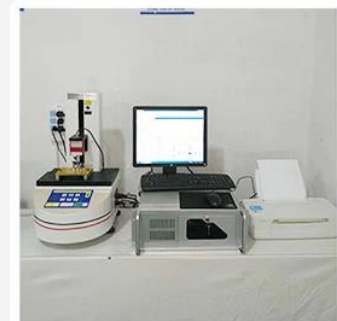
3. Load Curve Meter