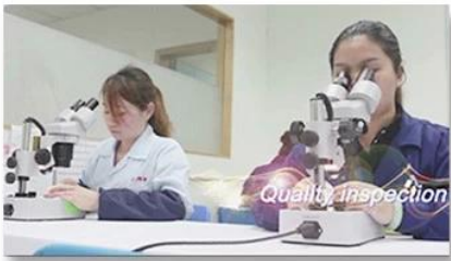
4. Quality inspection