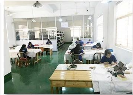
3. Assemble workshop