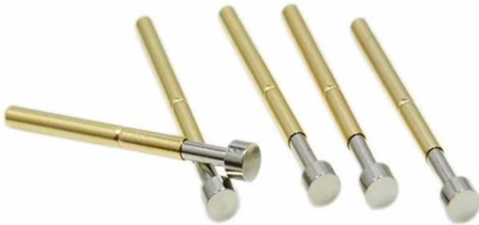
Πείρος αισθητήρα δοκιμής σειράς SF-P100