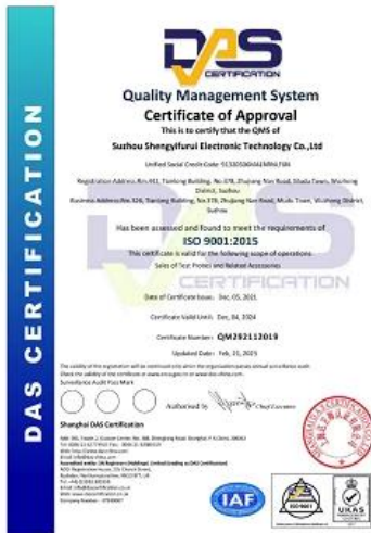
2023 ISO Certificate