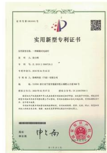
Patent for Honeycomb current probe