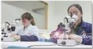
4. Quality inspection