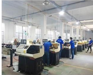
2. Lathe workshop