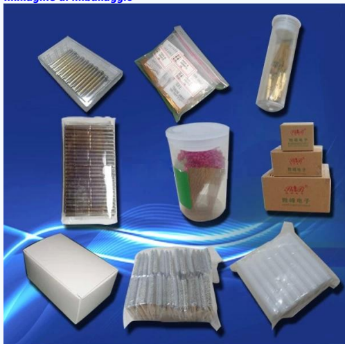
Immagine di imballaggio