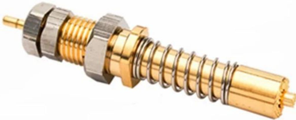
Disegno della sonda di contatto coassiale