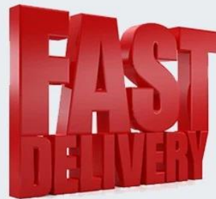
Immagine di fabbrica