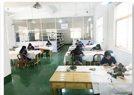
3. Assemble workshop