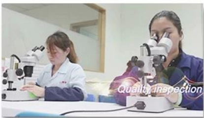
4. Quality inspection