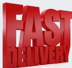
Immagine di fabbrica