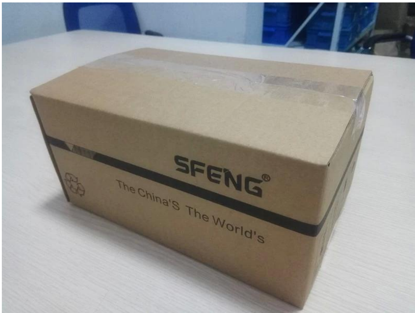
Certificazione di qualità