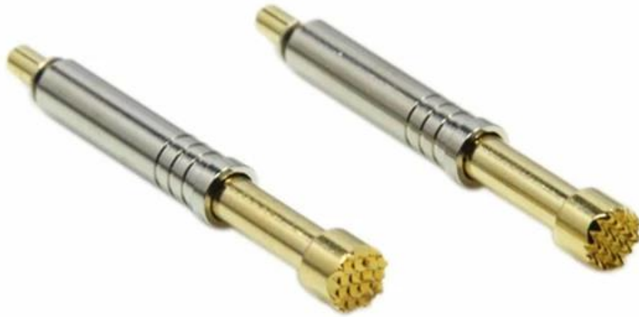
Disegno del pin della sonda personalizzato