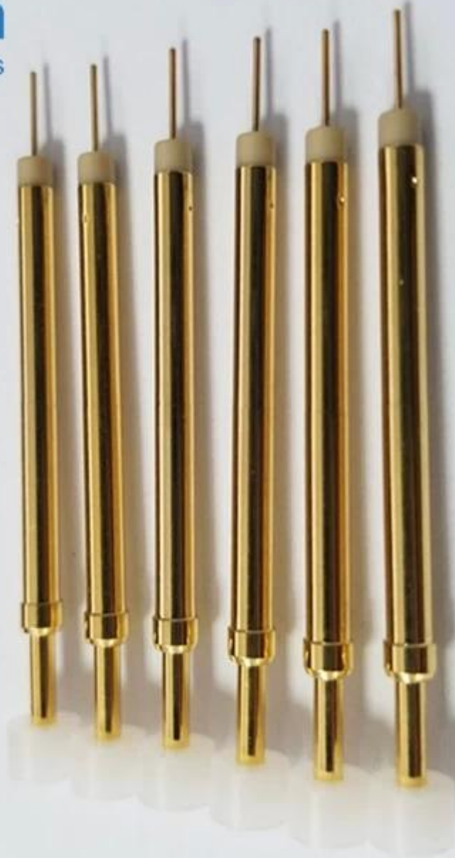
Commutazione test probe disegno