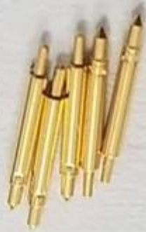
Disegno a perno a doppia testa