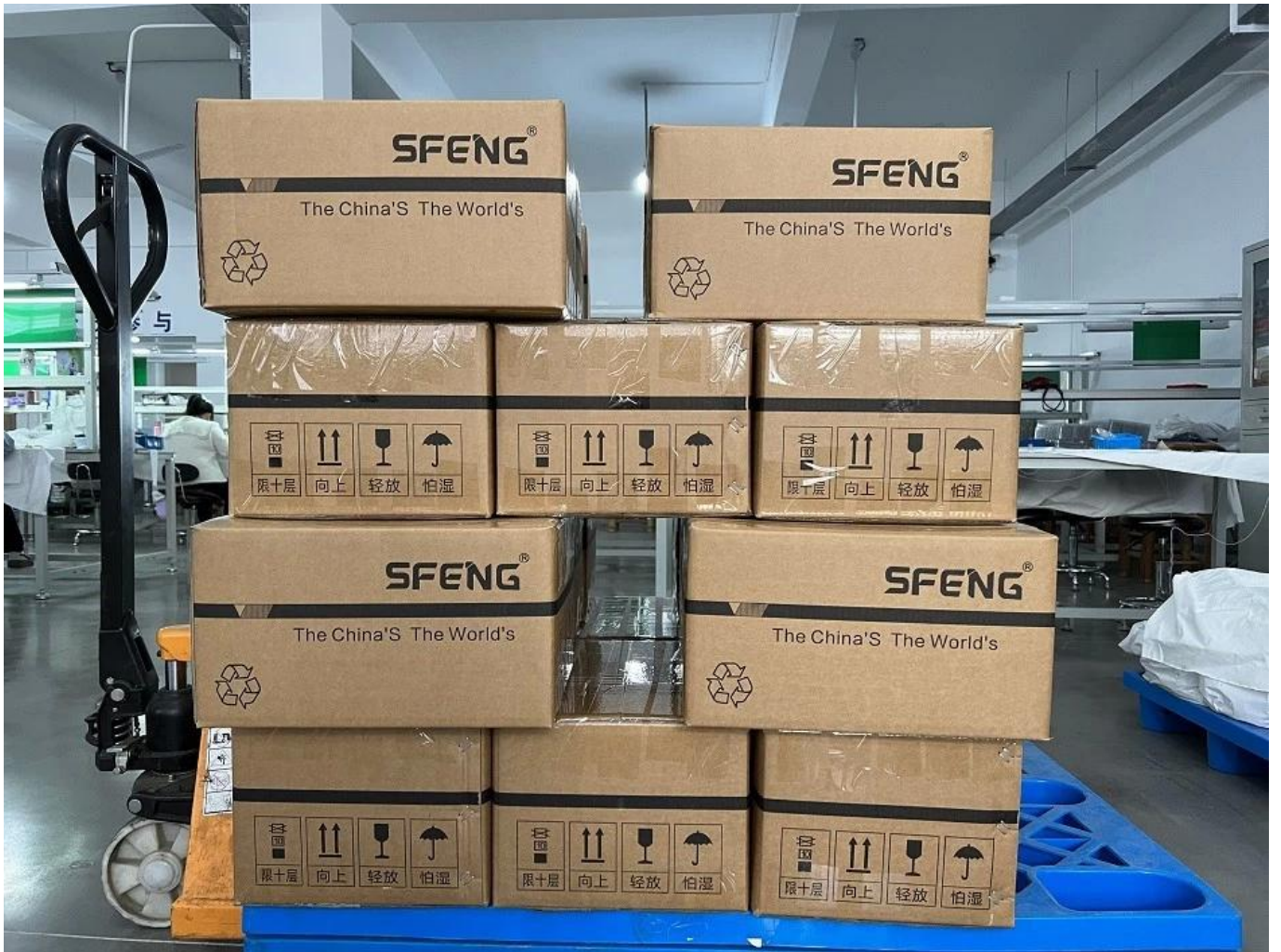
Flusso di produzione