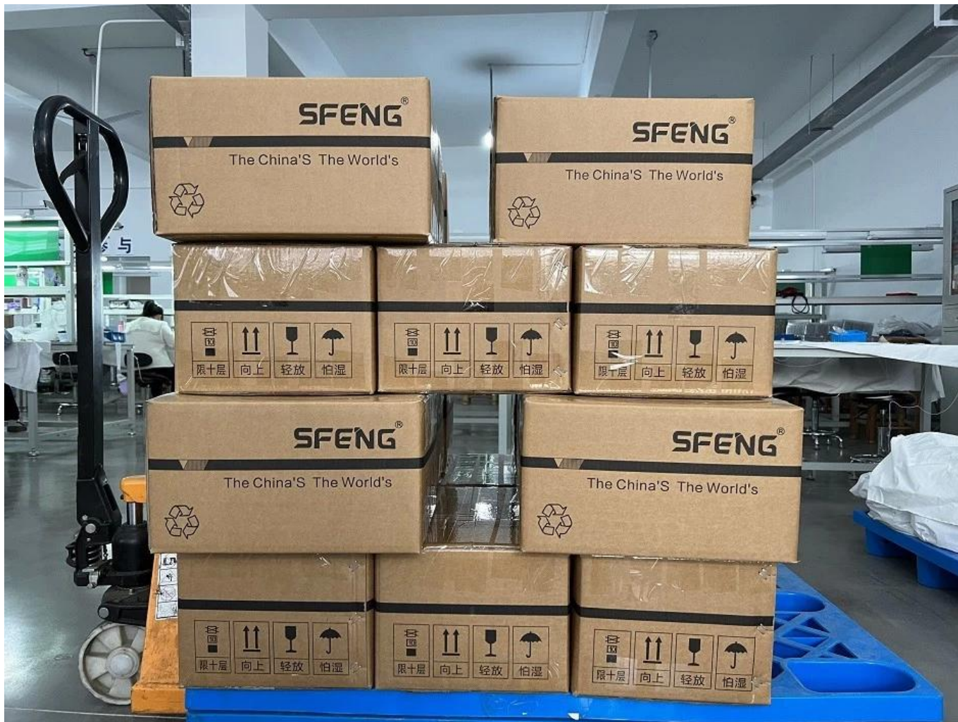
Flusso di produzione