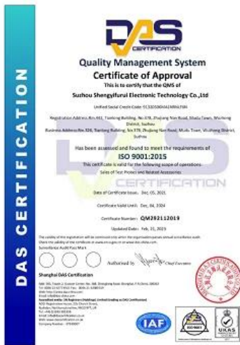
2023 ISO Certificate