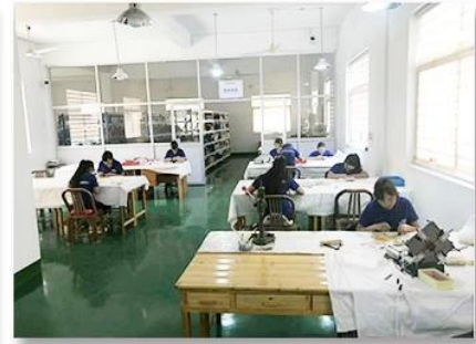
3. Assemble workshop