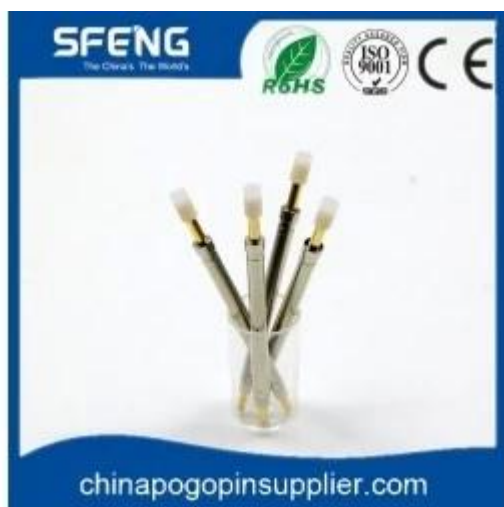
Immagine del prodotto