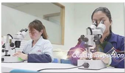
4. Quality inspection