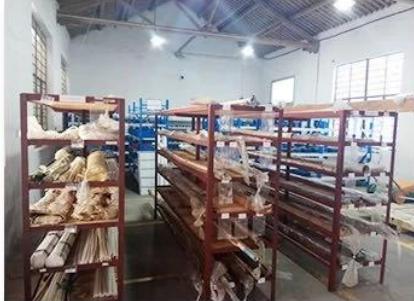
1. raw material warehouse